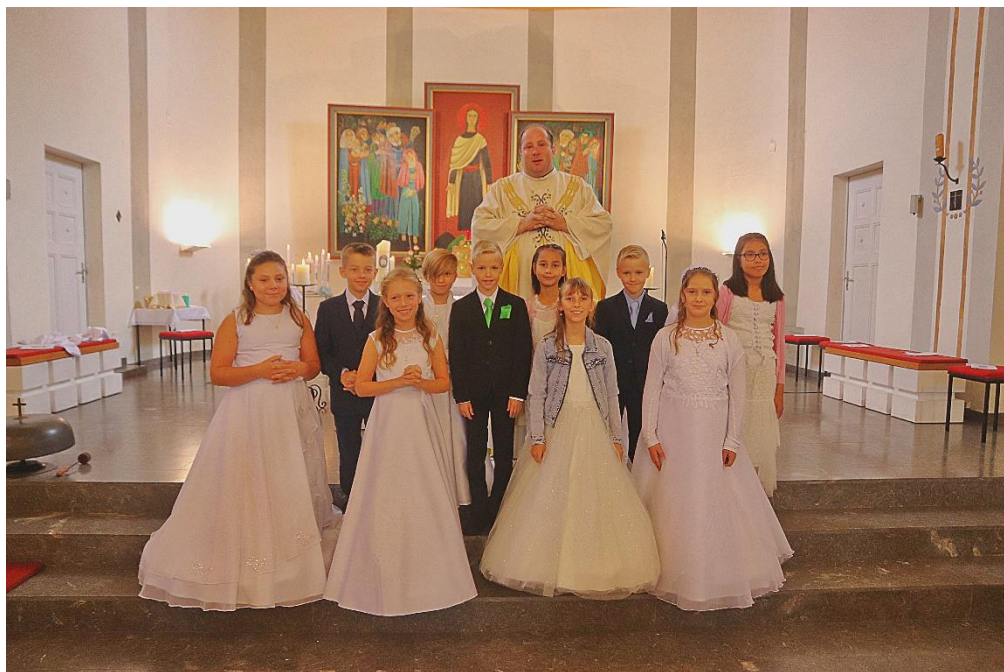
Kommunionkinder St. Barbara